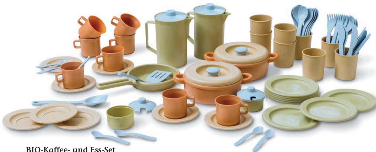
BIO-Kaffee- und Ess-Set

Unser großes Küchen-Set (79 Teile) bietet zahlreiche Spielmöglichkeiten. Spülmaschinen- und mikrowellengeeignet. Verpackung: brauner Pappkarton.